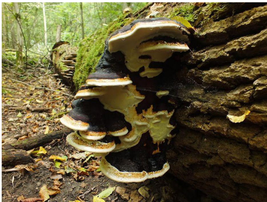
Wieloletnie owocniki pniarka obrzeżonego Fomitopsis pinicola w Puszczy Boreckiej.

Na październikowe spotkanie, które odbędzie się 13.X.2018 r., zapraszamy w teren. Proponujemy, podobnie jak w maju, wycieczkę do Parku Krajobrazowego Puszcza Zielonka. Spotykamy się o godzinie 9.30 przy leśniczówce Annowo (dojazd i powrót we własnym zakresie). Przewidujemy 3-4 godziny w terenie. W załączniku znajduje się mapa z lokalizacją leśniczówki.