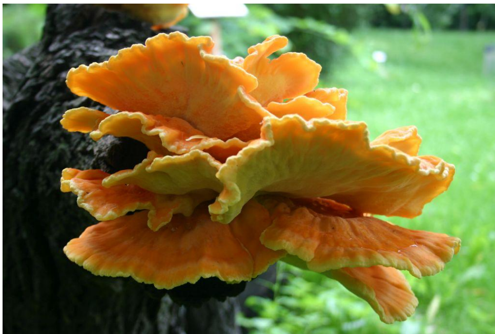
Żółciak siarkowy Laetiporus sulphureus w Ogrodzie Botanicznym Uniwersytetu Kazimierza Wielkiego w Bydgoszczy.

Na październikowe spotkanie, które odbędzie się 14.X.2017 r. , zapraszamy w teren. Proponujemy powtórne odwiedzenie parku w Radojewie i spojrzenie na jesienny aspekt mykobioty tego obiektu. Spotykamy się o godzinie 9-tej przed bramą parku (dojazd i powrót we własnym zakresie). Przewidujemy 3-4 godziny w terenie, czyli wspólne oglądanie roślin, zwierząt, dokumentowanie występowania jesiennych grzybów i rozmowy o przyrodzie.