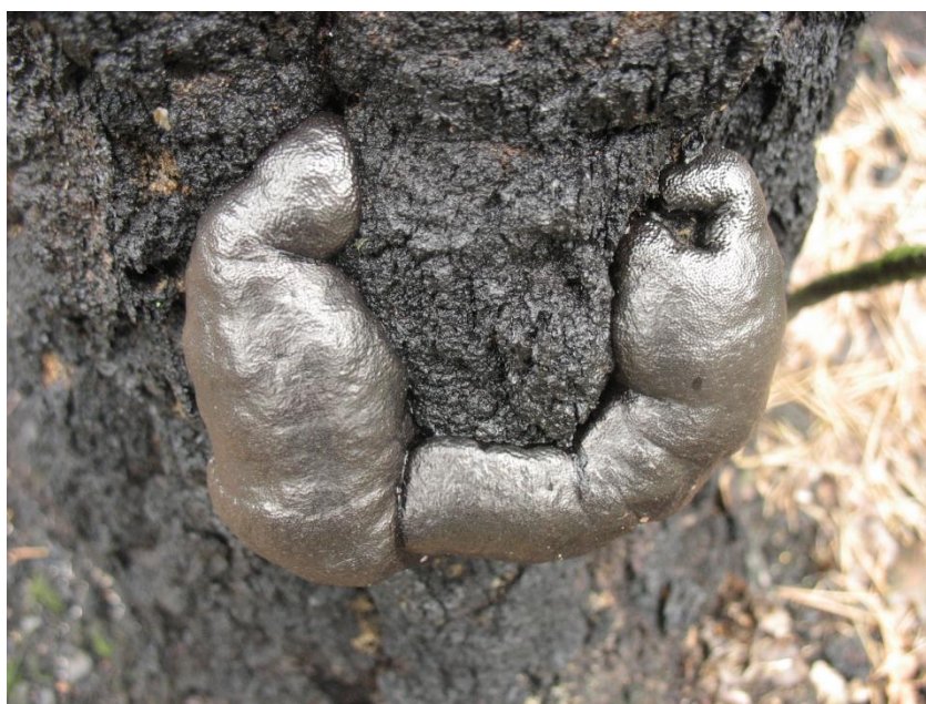
Daldinia vernicosa na pożarzysku w Kampinoskim Parku Narodowym.

Na majowe spotkanie, które odbędzie się 6.V.2017 r. , zapraszamy w teren. Proponujemy wycieczkę do parku w Radojewie (planowany rezerwat Kokoryczowe Wzgórze). Spotykamy się o godzinie 9-tej przed bramą parku (dojazd i powrót we własnym zakresie). Przewidujemy 3-4 godziny w terenie, czyli wspólne oglądanie roślin, zwierząt, dokumentowanie występowania wiosennych grzybów i rozmowy o przyrodzie.