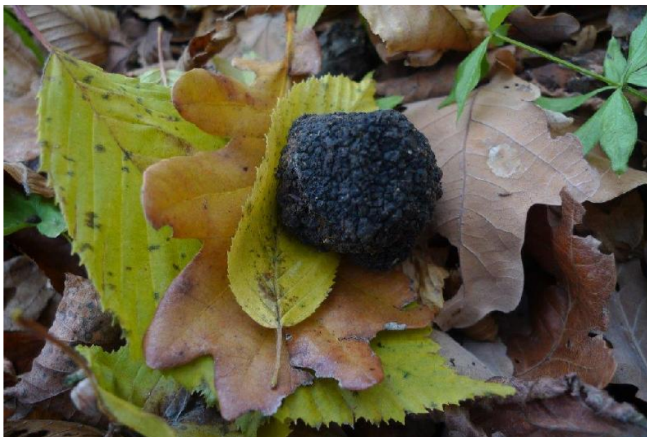
Trufła letnia Tuber aestivum .

Szanowni Państwo, spotkanie w dniu 26 października będzie w części poświęcone sprawom organizacyjnym i pomysłom na dalszą działalność sekcji mykologicznej Poznańskiego Oddziału PTB. Zapraszamy do udziału i dyskusji nad sposobem pogłębiania wiedzy o grzybach i rozwijania zainteresowań mykologicznych.