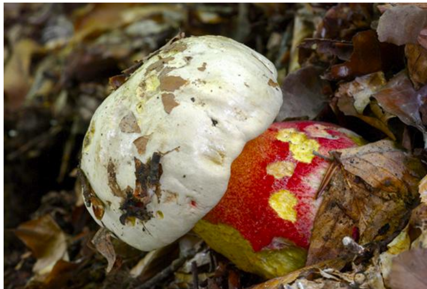
Borowik szatański ( Boletus satanas) w Górach Kaczawskich.